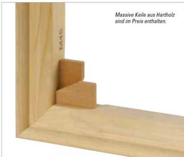
Massive Keile aus Hartholz sind im Preis enthalten.