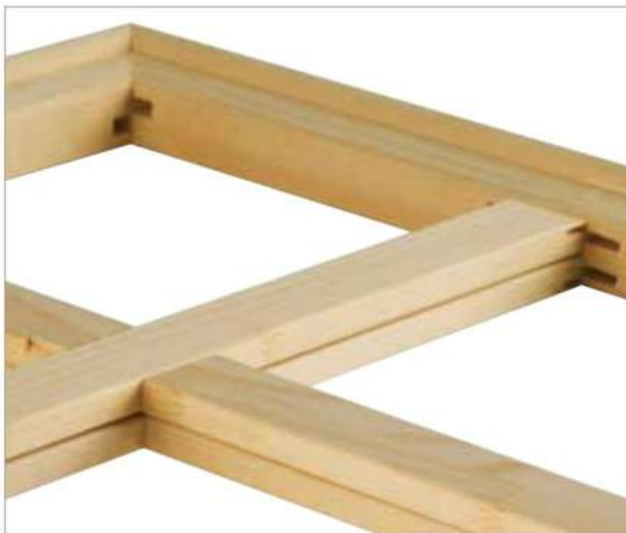
Die optionale neue 2-fach Schlitzung verleiht dem Keilrahmen ein Höchstmaß an Stabilität und Verzugfreiheit – auch bei extrem großformatigen Rahmen.