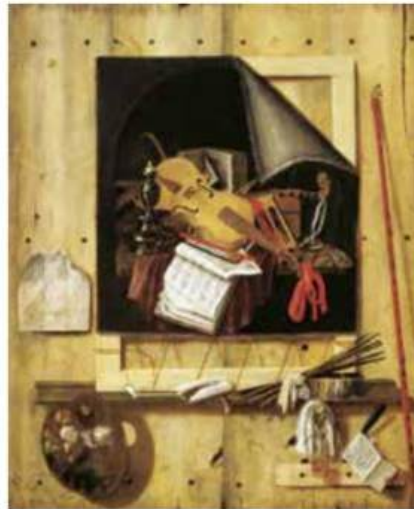
Abb. 1: Cornelis Norbertus Gijsbrechts, Trompe-l'œil mit Atelierwand und Vanitasstillleben , 1665, Öl auf Leinwand

In der Antike verwendeten die Maler in der Tafelmalerei massive Holzplatten, z. B. bei den griechisch-ägyptischen Mumienporträts. Die große Zeit des Leinwandbildes, und damit auch die des Keilrahmens, begann im Spätmittelalter. Ursache für den Übergang zur Leinwandmalerei waren die immer größer werdenden Bildformate. Im Malerbuch vom Berge Athos findet sich eine recht derb klingende Anleitung zur Herstellung von Keilrahmen: „Nagle vier Latten zusammen und ziehe das Tuch darüber, auf welches du malen willst.“ Nur wenige, mit Leinwand bespannte Rahmenkonstruktionen aus dieser Zeit sind bis heute erhalten geblieben. Bei Rahmen aus dem 15. Jh. sind die Eckverbindungen und stabilisierenden Querverbindungen verzapft und teilweise mit Nägeln gesichert. Die Leinwand wird aufgeklebt und zum Teil mit Holzstiften festgenagelt. Manche Bilder werden zusätzlich durch eine rückseitig eingelegte Holztafel stabilisiert. In Holland verwendete man zum Spannen der Leinwand eine Zeit lang Schnüre statt Nägel (Abb. 1).